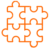
Listo para instalar